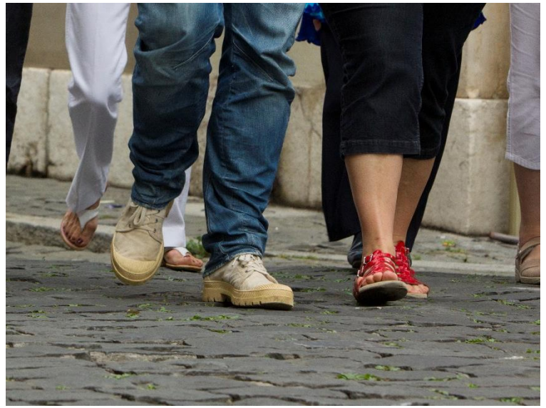
L'ECR-Genève en marche à vos côtés