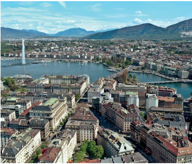
Le centre-ville de Genève avec le Jet d'eau