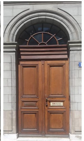
Entrée du Vicariat épiscopal

Depuis peu, l'ECR-Genève recherche en plus des fonds pour des projets spécifiques. Le « chemin de joie » est l'un des plus importants, en coût mais également en portée pastorale. L'espoir est permis de trouver le financement pour la réalisation de 12 mosaïques du spécialiste mondialement connu, l'artiste Marko Rupnik du centre Aletti de Rome. Une première pour lui en Suisse.