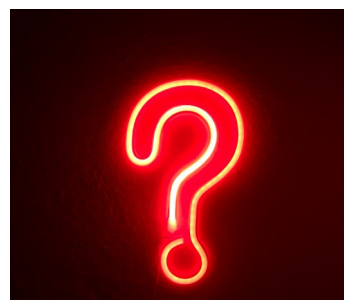
COURRIER PASTORAL Formulaire d'abonnement