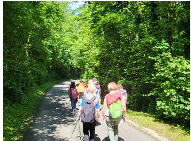
Samedi 25 mai, une vingtaine de femmes a participé à un pèlerinage pour les « femmes au cœur de mères » proposé par la pastorale des familles.