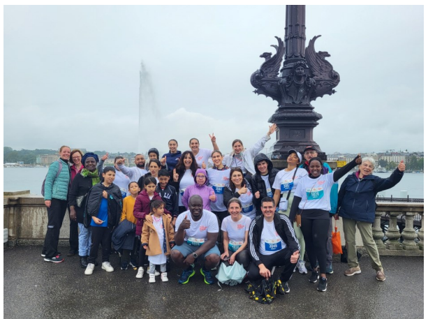
Le 2 juin une équipe de l'Eglise catholique romaine a participé avec élan à la course solidaire Race for Gift au bord du lac en bravant la pluie.