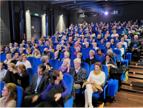
Du 1er au 5 mai 2024, 22 films, dix débats ont réuni le public aux Cinémas du Grütli pour l'édition 2024 d' IL EST UNE FOI sur le thème de l'Au-delà .