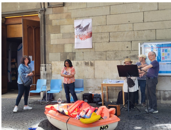
Les 15 et 16 juin, l'AGORA a organisé la lecture des noms des personnes disparues sur les chemins migratoires. Un acte de mémoire et de sensibilisation.