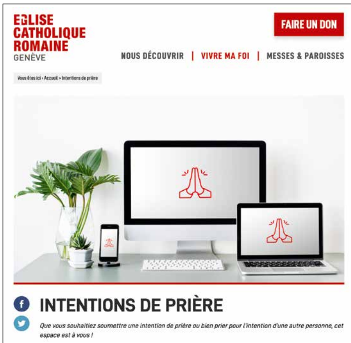
Un espace web dédié aux intentions de prière.

En effet, la prière n'est limitée par aucune frontière. Elle peut se pratiquer en tout temps, en tous lieux et gagne en « efficacité » lorsqu'elle est soutenue par d'autres. « Au-delà d'un acte de dévotion, d'humilité et de gratitude envers notre Créateur, elle est également un lien profond qui unit les croyants. Ce dialogue intime avec le divin nous accompagne dans les moments de joie et de peine de la vie quotidienne. Ainsi, les intentions de prières déposées ici expriment la diversité des expériences humaines et la quête spirituelle qui anime chacun », souligne l'ECR sur la page dédiée aux intentions de prière.